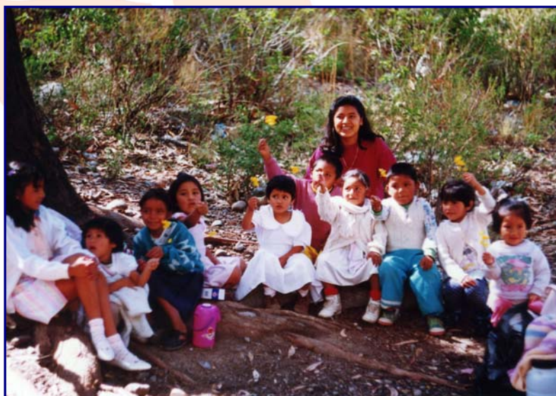
I bambini del Centro Benedetta D'Intino di Cochabamba (Bolivia) durante una passeggiata.