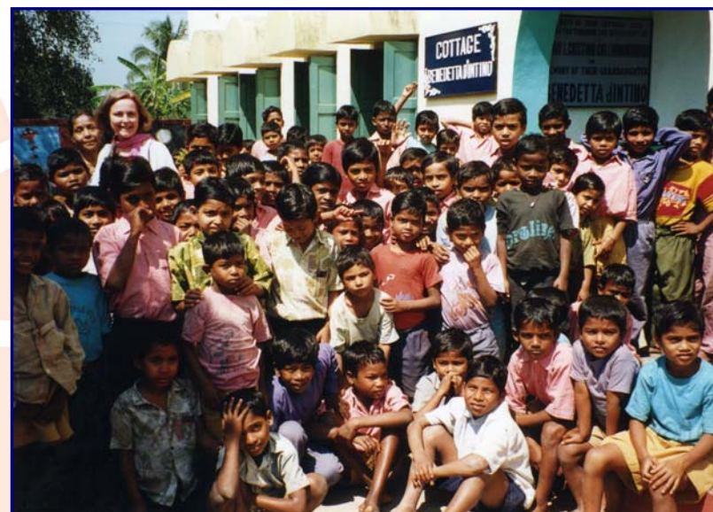
I bambini del Centro Benedetta D'Intino di Udayan (India) con Dominique Lapierre.