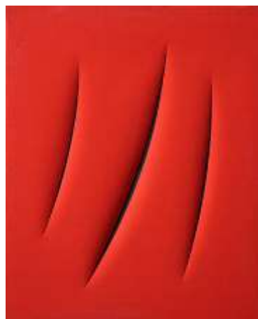
Lucio Fontana, Spazio concettuale. Attese.